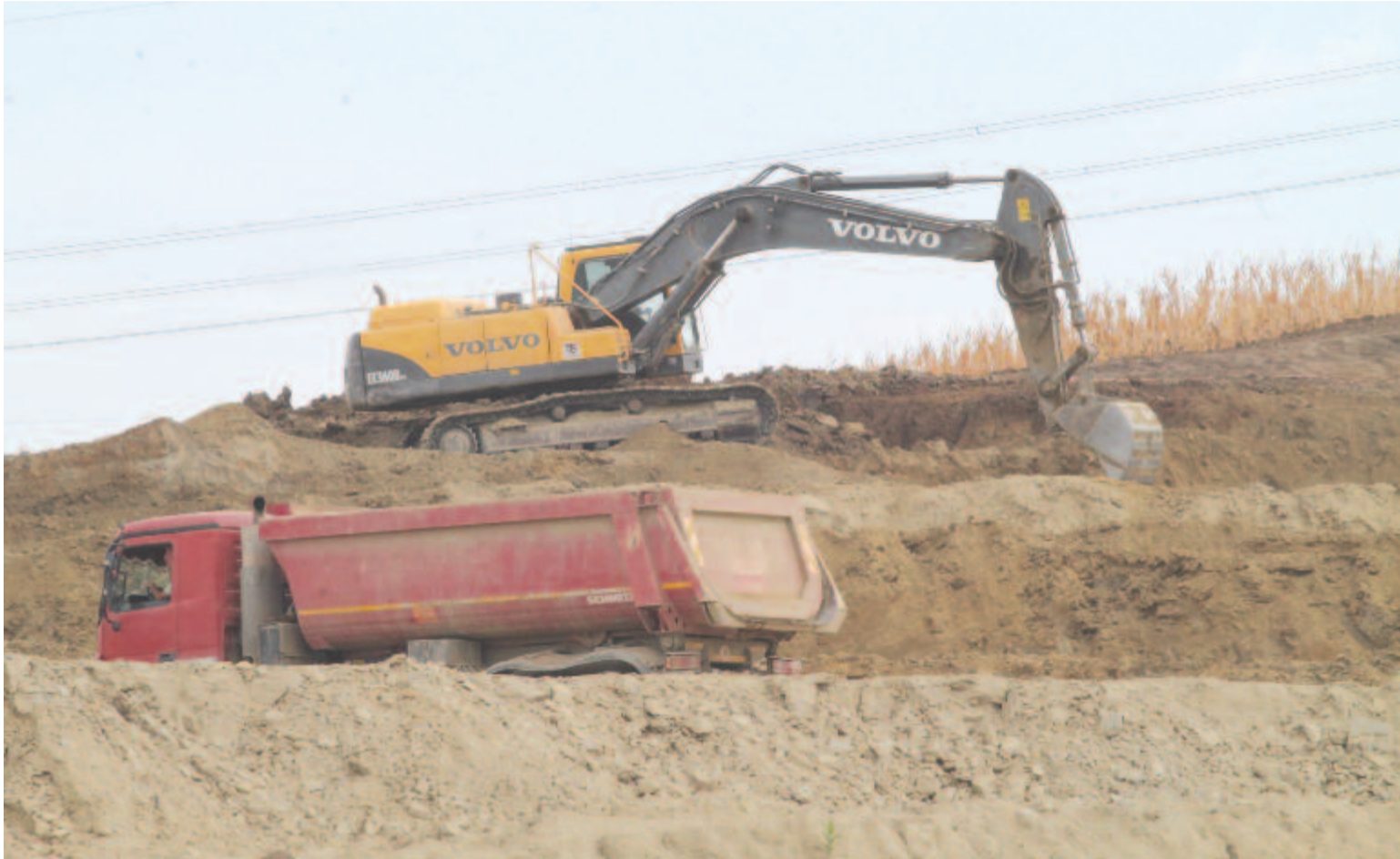
Egyes szakaszokon eddig is zajlott a munka